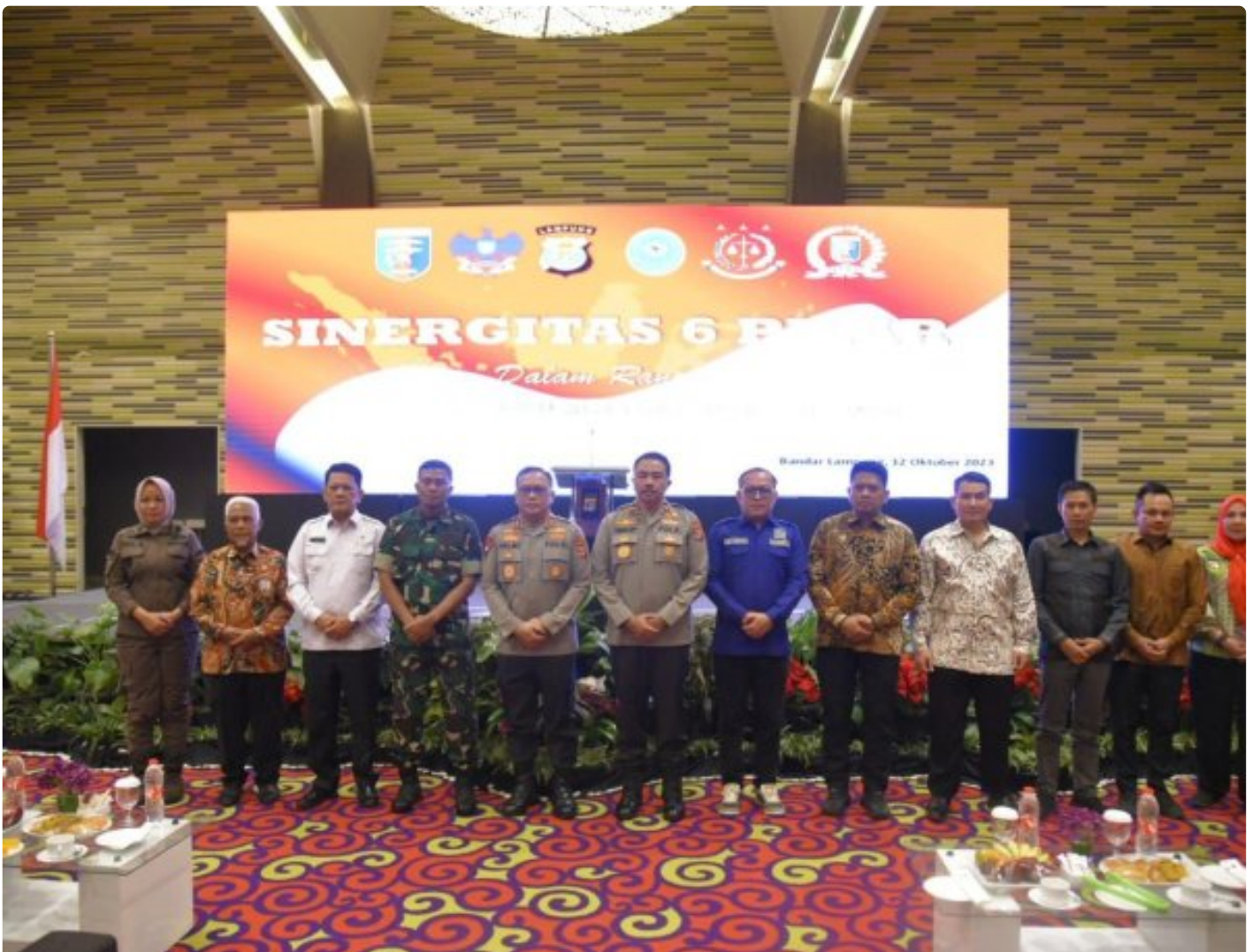
Sinergitas 6 Pilar Dalam Rangka Menciptakan Pemilu 2024 Yang Aman Dan Damai di Hotel Novotel Bandar Lampung

LAMPUNG- Polda Lampung Bersama Forkopimda Melaksanakan Apel Sinergitas 6 Pilar Dalam Rangka Menciptakan Pemilu 2024 Yang Aman Dan Damai di Hotel