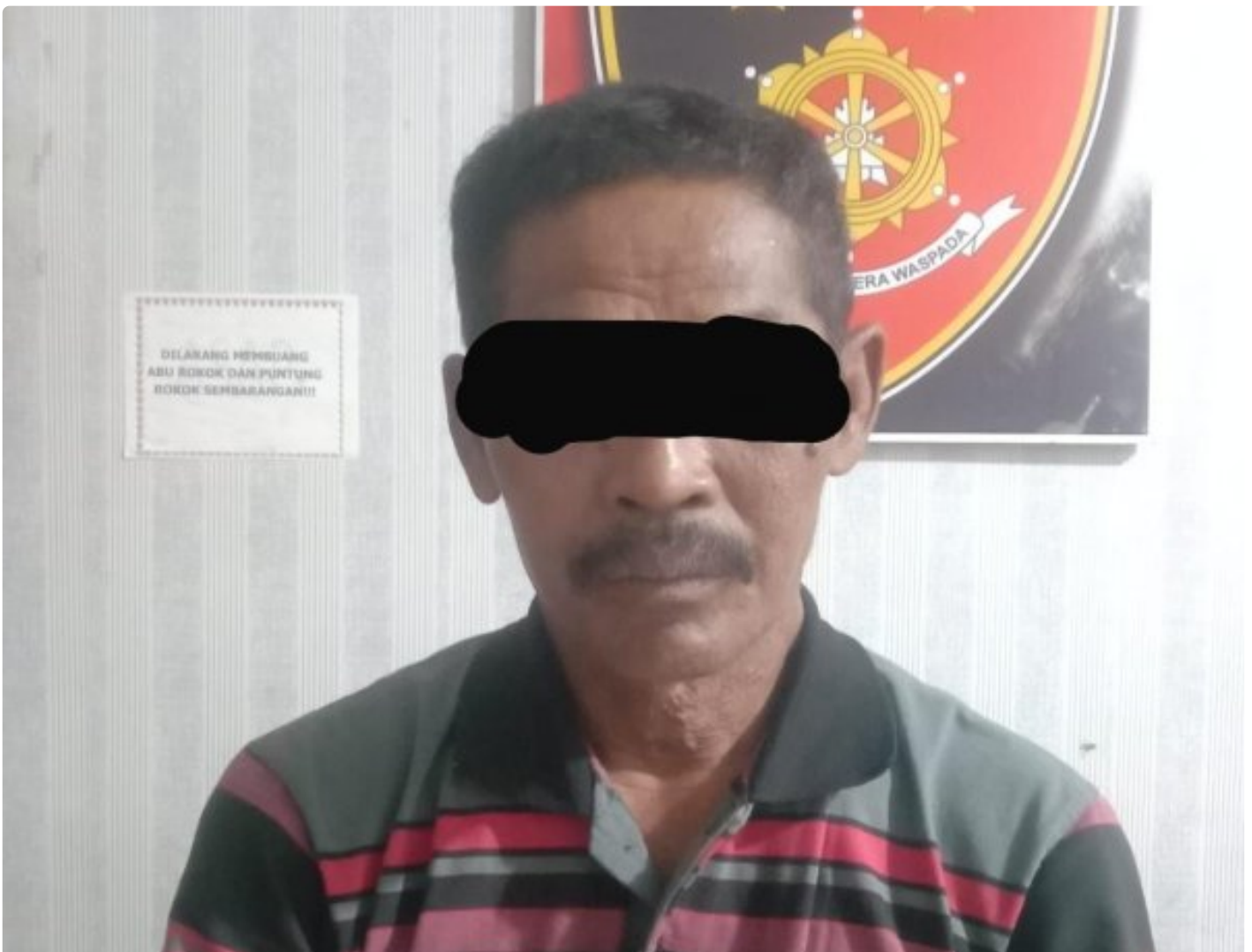
Pelaku Berinisial SO Alias SS (55) Warga Desa Fajar Asri Kecamatan Seputih Agung Kabupaten Lampung Tengah

MESUJI-Berhasil diungkap unit Reskrim Polsek Simpang Pematang Polres Mesuji Polda Lampung. Pelaku Pencurian dan Penggelapan di Bulan September 2023 lalu yang terjadi di Desa Margo Makmur Kecamatan Simpang Pematang